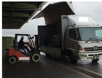
パレット借入れによるパレット輸送の実施